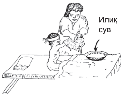
БЕМОРНИ ҲАР КУНИ ЧЎМИЛТИРИНГ

Беморни тоза тутиш муҳим. У ҳар куни чўмилтирилиши керак. Агар у ётган жойидан тура олмайдиган даражада касал бўлса, баданини илиқ сувда намланган юмшоқ сочиқ билан артинг. Унинг уст-бошлари, чойшаблари ва устига ёпиладиган нарсалари ҳам тоза тутилиши керак. Бемор ётган жойга овқат бўлаклари ва ушоқлар тушиб қолмаганига эътибор беринг.